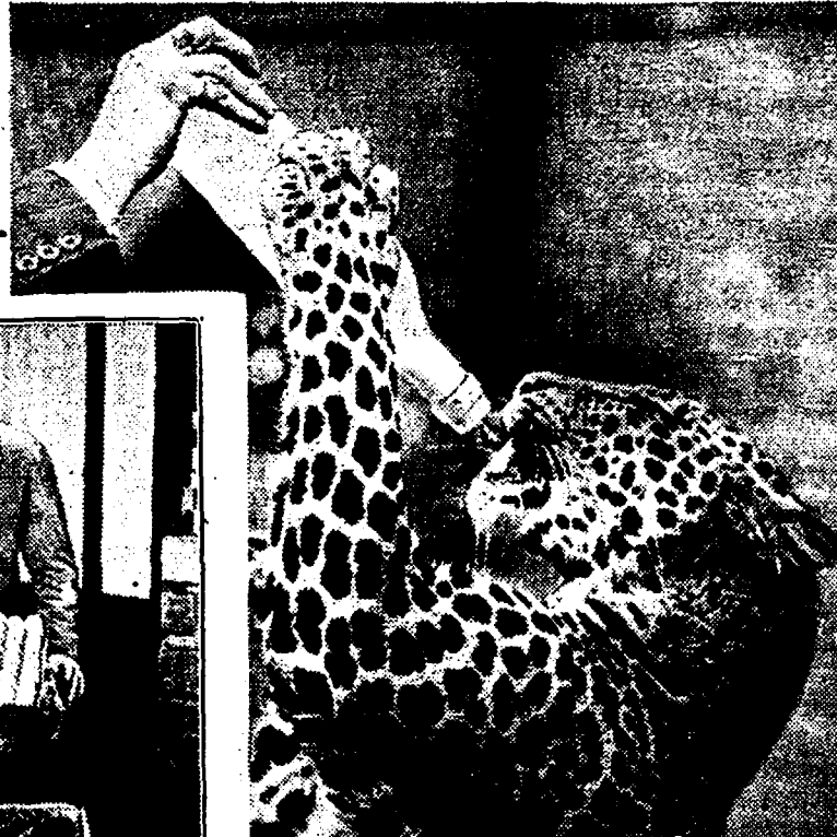
De prachtige panter in het dierenpark Wassenaar heeft behoefte aan melk. Komt de oppasser niet snel genoeg, dan staat hij op den uitkijk naar zijn ochtend-drank. Maar wild wordt hij wanneer de flesch gebracht wordt, dan is er geen houden meer aan. Gulzig slokt hij de melk naar binnen en het is zaak voor den oppasser om weg te komen.