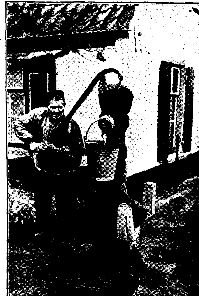
Op het platteland is de pomp nog altijd van groot belang voor de watervoorziening en het is dan ook zaak haar goed tegen de vorst te beschermen. De gemeentepomp van Eembrugge is reeds stevig ingepakt.