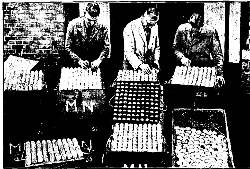
Gelijktijdig met den aanvang van de eierendistributie zijn zoowel voor den winkelier als den groothandel nieuwe maximum-prijzen vastgesteld. De eieren worden genummerd van 1 t.m. 6. Een groothandelaar in eieren bezig met het stampelen van de nummers.

Per rijtuig naar het ziekenhuis. — Nummering van eieren. Stijgend water. — Vogelfotografie. — Naamloze straat.