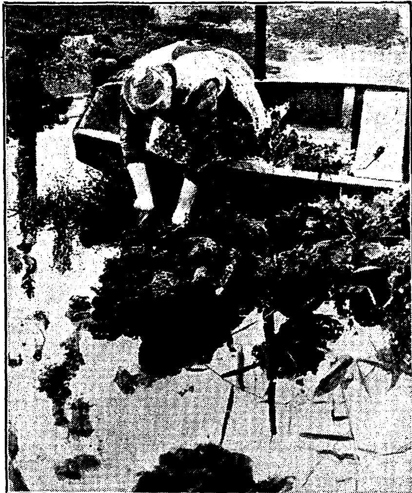
Tengevolge van den aanhoudenden regen is het water in de slooten in de Betuwe de laatste dagen aanmerkelijk gestegen. Op vele plaatsen zijn de moestuinen ondergelopen, zoodat men er met een bootje op uit moet om nog wat van de groente te reddèn. Kool halen per roeboot.